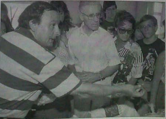
El arqueólogo se dirige al público del yacimiento en 1999.

A día de hoy, gracias a esta labor, el yacimiento de Numancia es mucho mejor entendido que