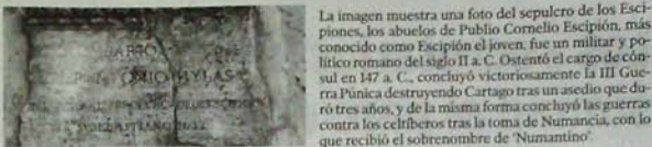
La imagen muestra una foto del sepulcro de los Escipiones, los abuelos de Publio Cornelio Escipión, más conocido como Escipión el joven. Fue un militar y político romano del siglo II a. C. Ostentó el cargo de Cónsul en 147 a. C., concluyó victoriosamente la III Guerra Púnica destruyendo Cartago tras un asedio que duró tres años, y de la misma forma concluyó las guerras contra los celtiberos tras la toma de Numancia, con lo que recibió el sobrenombre de 'Numantino'.

Y es que, mantener un enfrentamiento de 20 años contra un pequeño pueblo de Hispania hasta vencerlo por hambre, no era algo de lo que se pudiese presumir de demasiado. Y mucho menos con la llegada de los nacionalismos en la Europa del Romanticismo, cuando