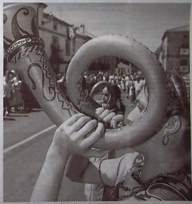
Garray ofreció escenas propias de otra época. SANTIAGO BELLO