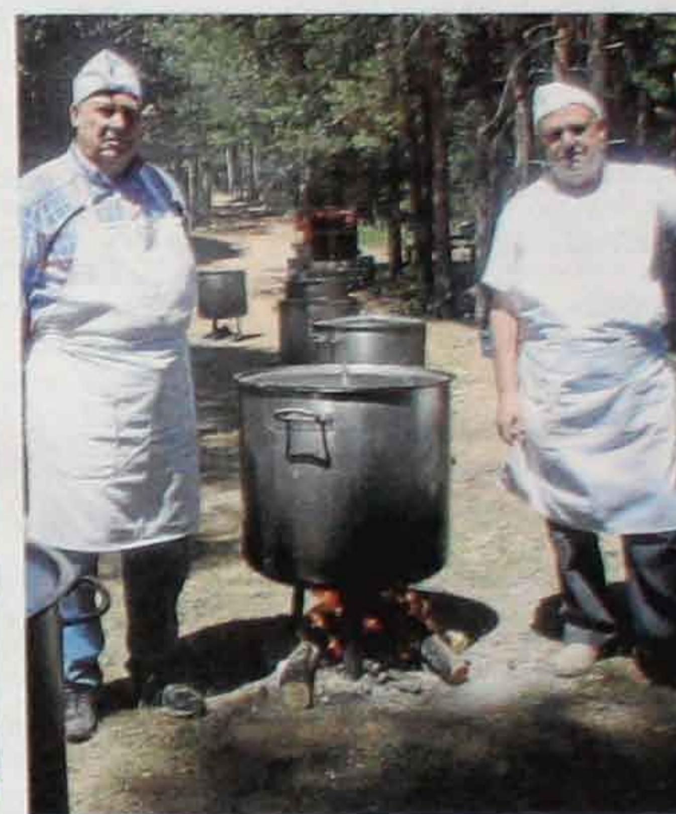
Preparativos de la caldereta en San Leonardo. CH. A.