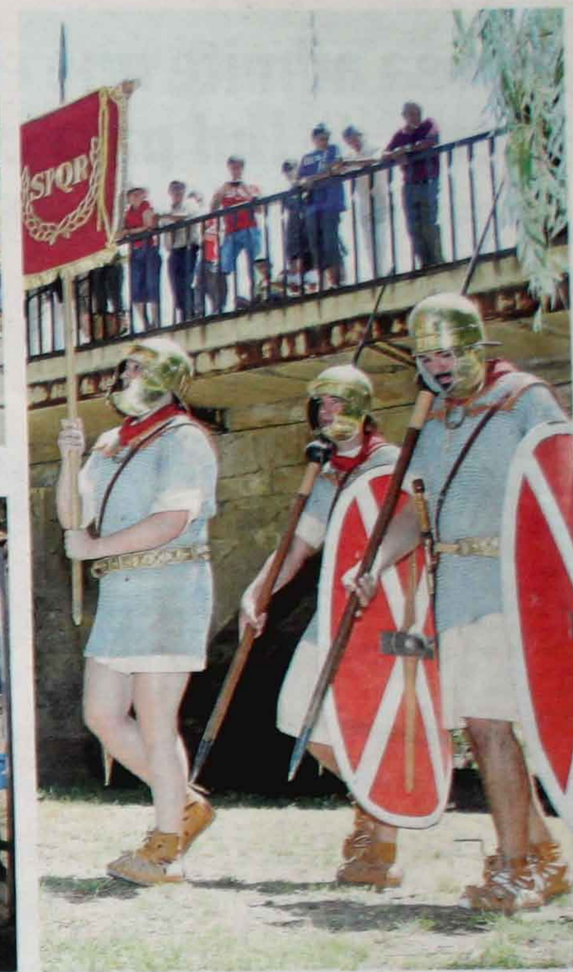
Celtiberos y romanos volvieron a citarse ayer en Garray. L.A. TEJEDOR