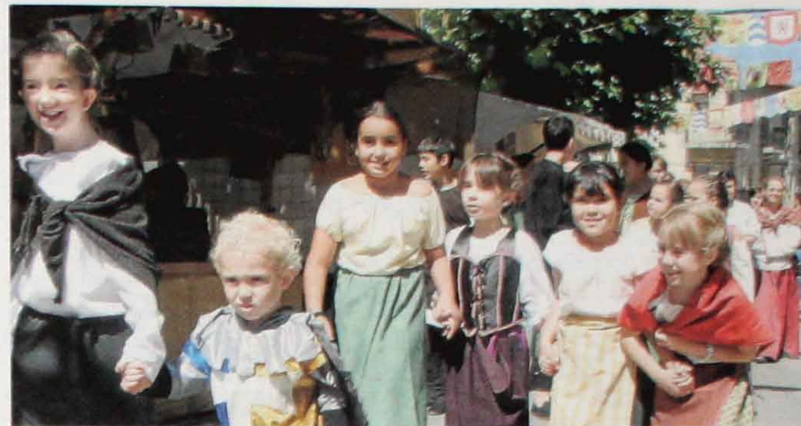
Niños de la Asociación Molino de Almagre en pleno Medieval, en el mercado de Ólvega. S. RELO