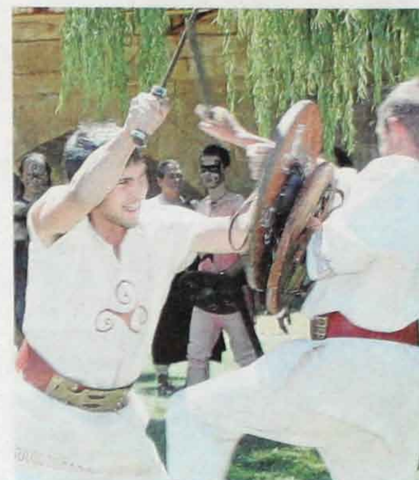
Numantinos en plena lucha, en Garray. L.A. TEJEDOR